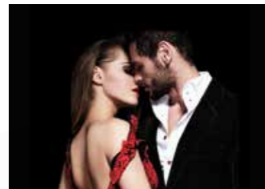
KISS ME, KATE 3 APRILE