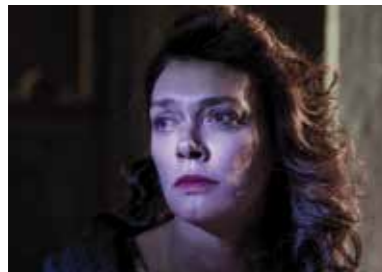
QUESTI FANTASMI! 17 NOVEMBRE