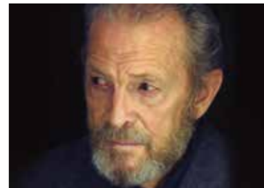
IL COSTRUTTORE SOLNESS 28 FEBBRAIO