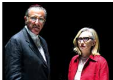
IL PENITENTE 28 GENNAIO