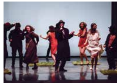
IL RACCONTO D'INVERNO DALL'11 AL 13 FEBBRAIO