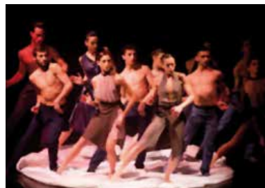
MM CONTEMPORARY DANCE COMPANY GERSHWIN SUITE SCHUBERT FRAMES 12 GENNAIO