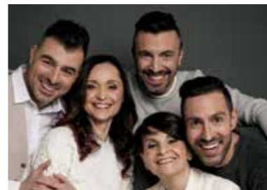
OBLIVION LA BIBBIA RIVEDUTA E SCORRETTA 19 MARZO