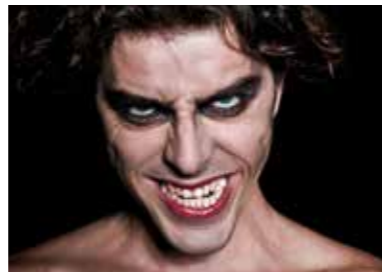
IL MAESTRO E MARGHERITA 21 DICEMBRE